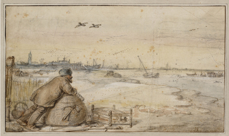
tekening: De eendenjager

14. Waardoor lijkt het of je heel ver weg kunt kijken op het schilderij?